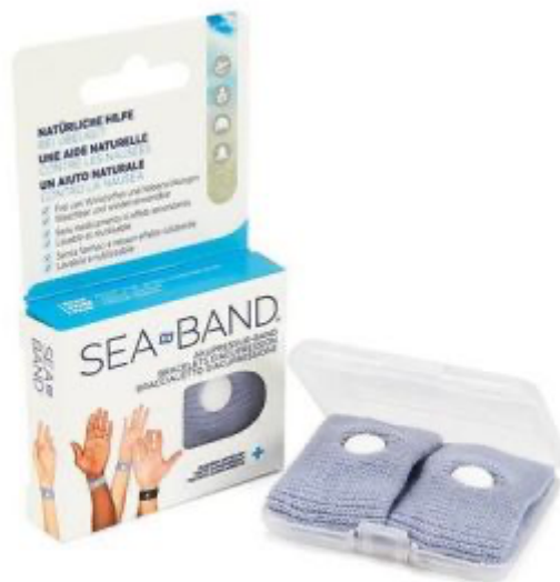
BRACELET ANTI NAUSEES Adulte gris Boite de 2

On retrouve dans le Top 9 des marques les plus vendues, un accessoire incontournable faisant parti du Top 20 des produits les plus recherchés sur le Web ces 3 dernières semaines :