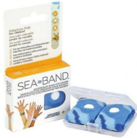
BRACELET ANTI NAUSEES Enfant bleu Boite de 2